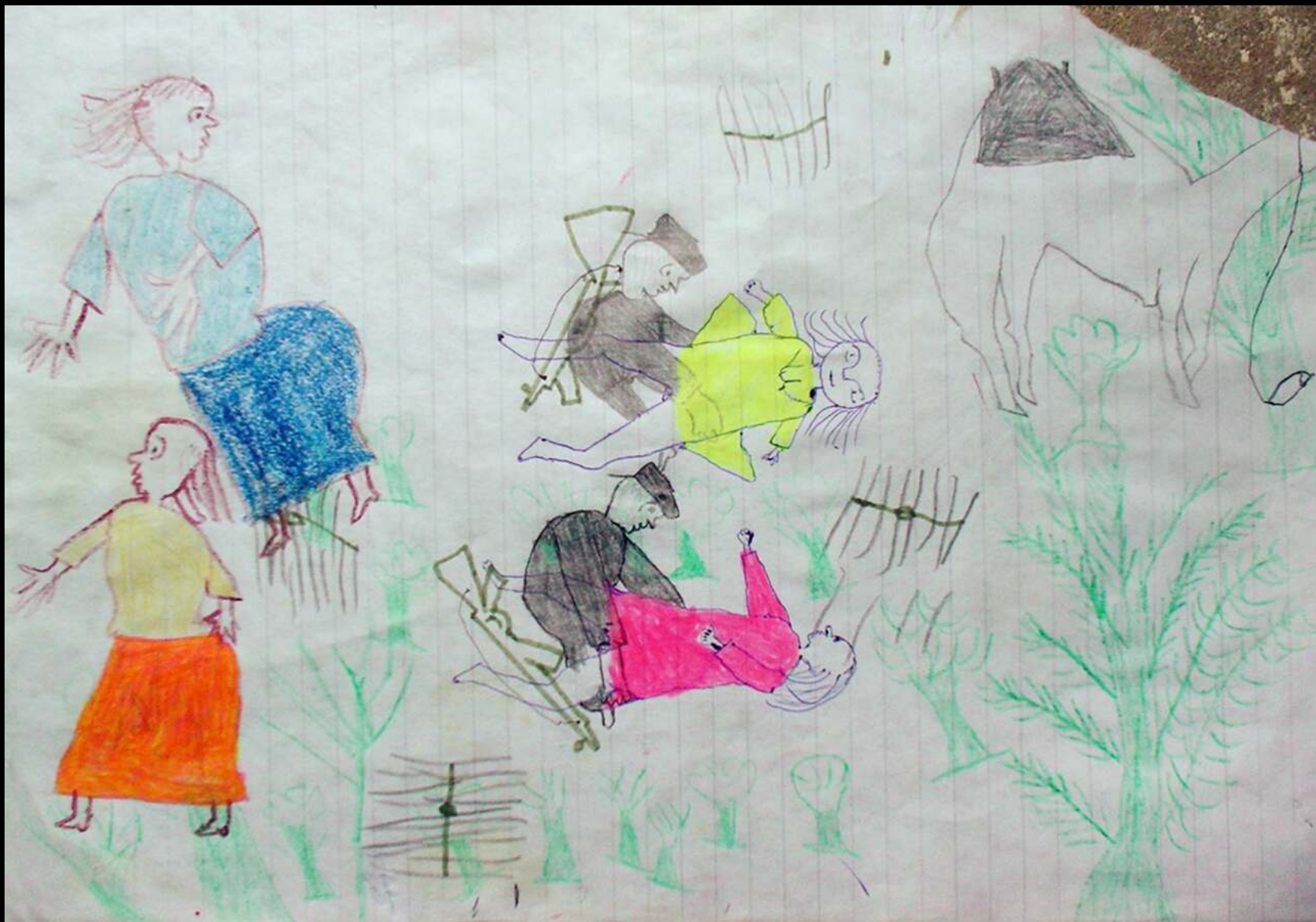
Desenho de criança do Darfur.