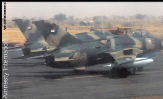
Aviões militares utilizados para bombardeamentos às populações indefesas