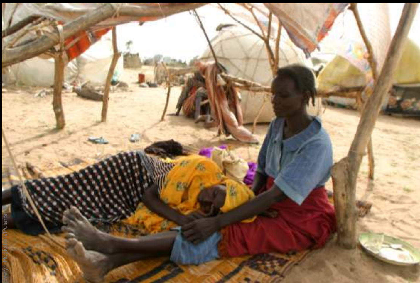
Mulheres num “abrigo” de um dos campos de refugiados.